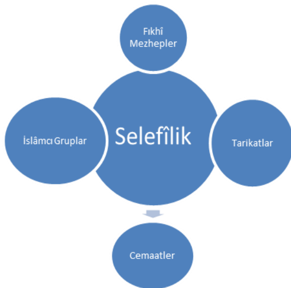
Şekil 2: 21’nci Yüzyılda Selefliğin Alanı

Görüldüğü gibi Müslümanlar için fikhî mezheplerin rolü yalnızca ibadet alanları ile sınırlıdır. Buna karşılık gündelik yaşamı ve siyasî davranışları güdüleyen ana akım Selefliğe tutunmuş İslâmcı gruplar ve tarikatlardır. Bu açıdan bakıldığında, İslam coğrafyasında iki büyük anlatı vardır; bunlardan birisi Seleflik, diğeri de Şîîlik’tir. Buna karşılık diğere anlatılar daha çok Selefliğin ağına tutunan vassal kimliklerdir. Söz konusu gruplar ya Selefi yaklaşım adına kavga etmekte ya da ondan rol devşirmektedir. Elbette bu ön tespit, Selefi etkiden bağımsız biçimde varılmaya çalışan cemaat ve tasavvufî grupların olmadığı